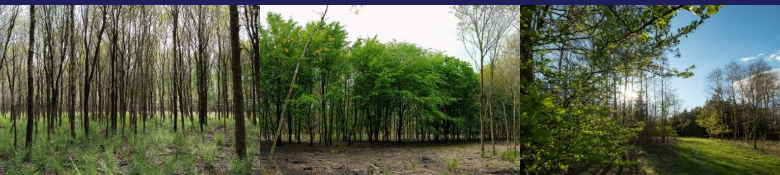
bos na aanplant 4 jaar

Eind 2020 vroegen wij alle inwoners van Heinenoord en alle abonnees van deze nieuwsbrief om een enquête in te vullen over hun wensen voor de inrichting van dit nieuwe bos. In opdracht van grondeigenaar a.s.r. wordt het bos nu ontworpen. De wensen die uit de enquête naar voren kwamen, neemt a.s.r. mee bij het ontwerp. Wanneer het eerste ontwerp klaar is, organiseert a.s.r. een bijeenkomst. Het ontwerp wordt dan aan u gepresenteerd en u kunt hierop reageren. Onder andere via deze nieuwsbrief ontvangt u op dat moment een uitnodiging hiervoor.